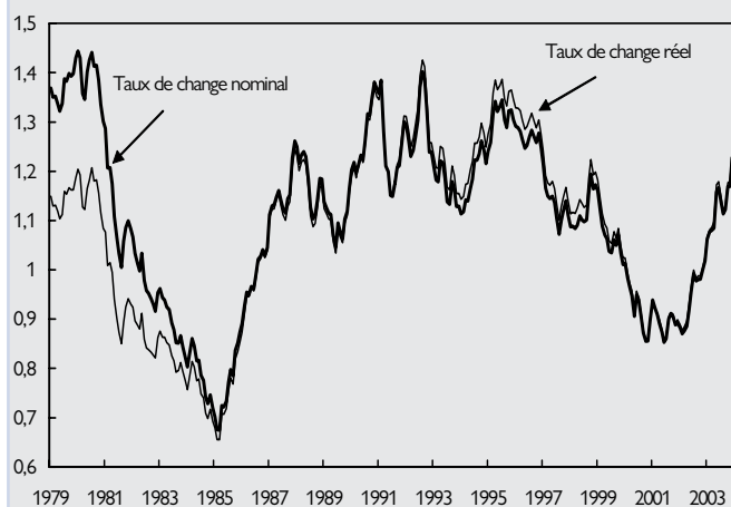
GRAPHIQUE 1 : TAUX DE CHANGE EURO/DOLLAR