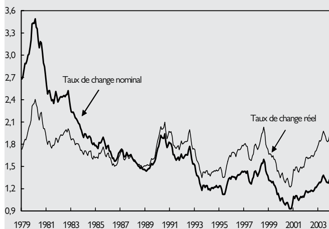
GRAPHIQUE 2 : TAUX DE CHANGE EFFECTIF DE L'EURO