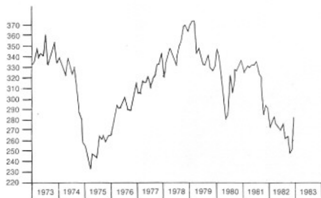
ÉTATS-UNIS Commandes nouvelles de biens durables en volume Données mensuelles cvs en milliards de dollars constants (1967)