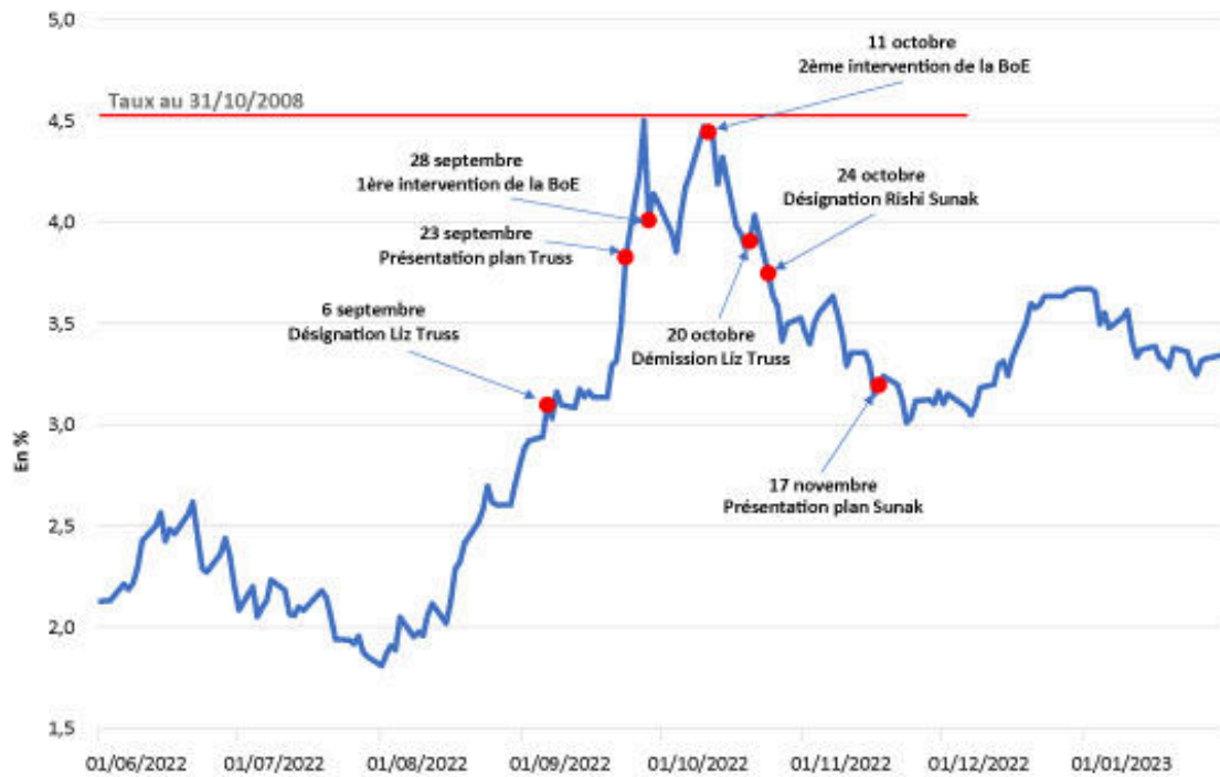
Graphique 2. Rendement des obligations d'État à 10 ans au Royaume-Uni