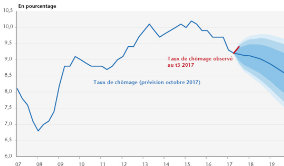
Graphiques 1. Taux de chômage réalisé et prévu

Note : Nous associons à notre projection un intervalle de confiance simulée à l'aide de la méthode de Monte-Carlo pour 15 000 simulations. Le premier intervalle est à 75 %, le deuxième à 90 % et le troisième à 95 %.