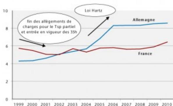
Évolution du taux de temps partiel des hommes 15-64 ans (en %)

Certes les Françaises ont été davantage touchées par la croissance du temps partiel que les Français, mais cette croissance a été limitée puisque les créations d'emplois à temps partiel entre 1999 et 2010 n'ont contribué qu'à hauteur de 21 % aux créations totales d'emplois. A contrario , en Allemagne, le temps partiel a été le moteur de l'emploi sur la période, et les Allemandes ont été les principales concernées par la réduction individuelle du temps de travail : elles représentent 70% du bataillon d'emplois à temps partiel créés durant la période. Ainsi, non seulement la France a créé plus d'emplois que l'Allemagne entre 1999 et 2010, mais le choix d'une réduction collective plutôt qu'individuelle du temps de travail a conduit à une répartition de l'emploi plus équilibrée entre hommes et femmes.