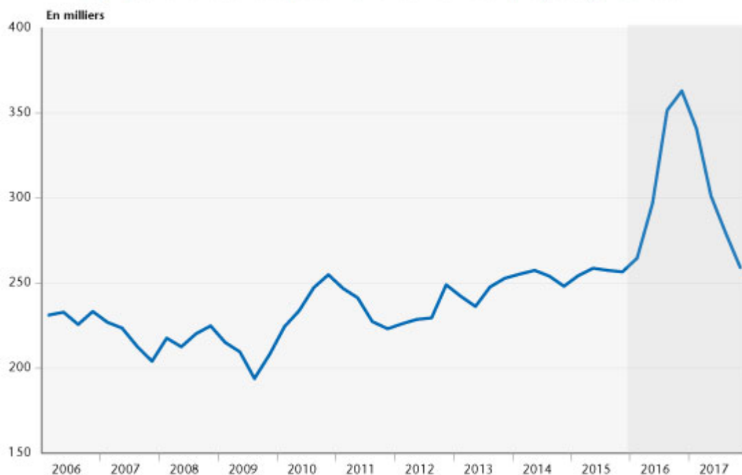
Graphique 1. Formation des personnes en recherche d'emploi (stock), 2006-2017