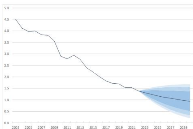
1. Situation de taux durablement bas