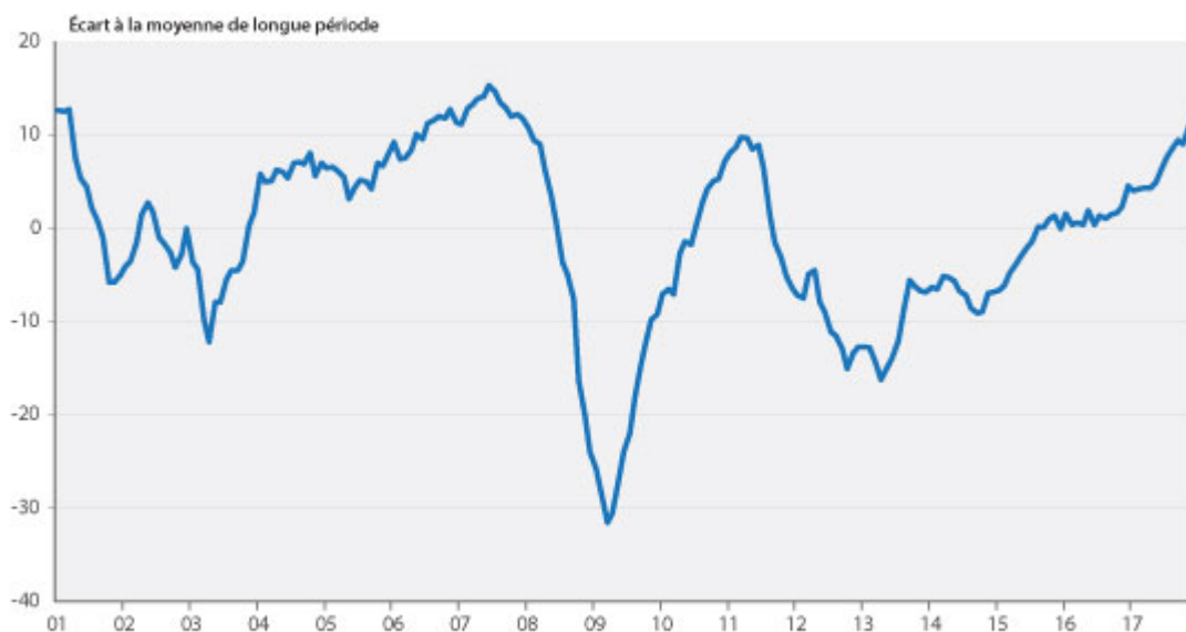
Graphique 1. Climat des affaires en France

La publication ce jour des indicateurs de confiance dans les différentes branches confirme l'optimisme des chefs d'entreprises interrogés par l'INSEE en décembre. Le climat général des affaires a rejoint son niveau de fin 2007, dépassant son pic de rebond de début 2011.