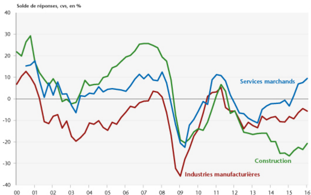
Graphique 2. Tendances prévues des effectifs